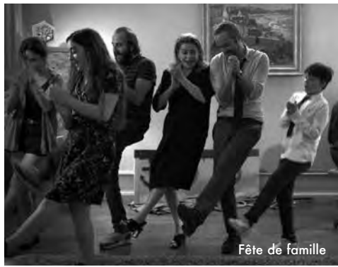
Fête de famille