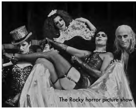
The Rocky horror picture show