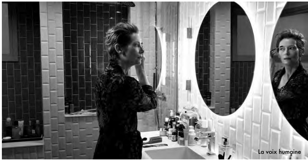
La voix humaine