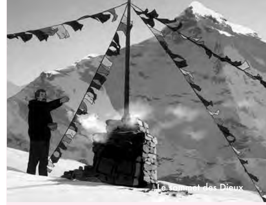
Le sommet des Dieux