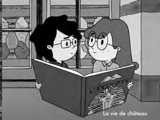
La vie de château