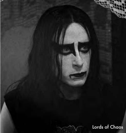
Lords of Chaos