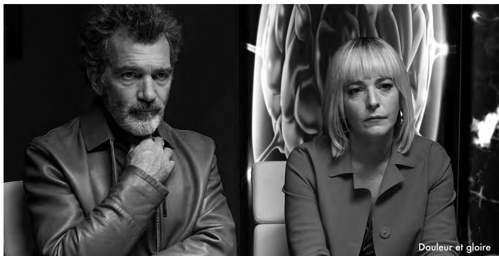
Douleur et gloire

Douleur et Gloire n'est pas la cathédrale baroque et hystérique qu'on pourrait attendre d'un film avec un tel titre, d'un tel cinéaste. Non, si Pedro Almodóvar n'a pas eu peur de se frotter ici aux grands totems, la vie et l'œuvre, le désir et la création, la réalité et la fiction, il l'a fait avec un calme et une évidence qui ont quelque chose de stupéfiant, faisant de ce film l'un de ses meilleurs, et de ses plus autobiographiques. [...] Il n'a rien de narcissique ni de complaisant. Il est, plutôt, d'une humanité telle qu'il ménage à chaque rôle, du médecin se penchant sur la kyrielle de maux dont est atteint [...] jusqu'à sa mère mourante lui assénant sans aigreur quelques terribles reproches, une épaisseur et une dignité auxquels les comédiens, tous exceptionnels, donnent magnifiquement corps. next.liberation.fr