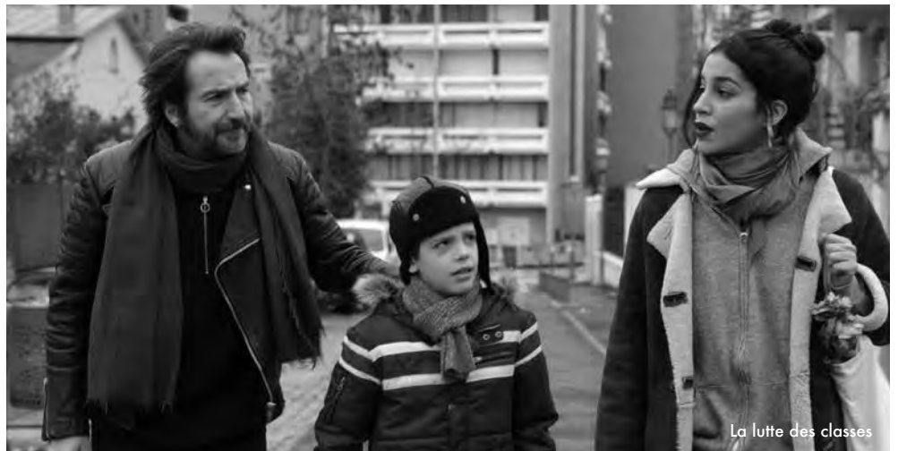
La lutte des classes

À la fin des années 80 en Norvège, le jeune musicien Euronymous fonde le groupe Mayhem et devient l'épicentre de la nouvelle scène black metal norvégienne. Sa rencontre avec Varg Vikernes, lui-même fondateur du projet black metal Burzum et en apparence introverti et timide, va précipiter les membres de son cercle dans une surenchère criminelle. Åkerlund fait le choix de se concentrer sur ses héros plutôt que leur musique, en s'évertuant à mettre en scène des passionnés tantôt dépressifs, tantôt criminels. [...] Plus qu'un simple biopic, Åkerlund parvient à s'approprier les codes du genre pour livrer un témoignage à la fois touchant et glaçant sur l'âge d'or du black metal norvégien. Lords of Chaos est une œuvre brute et brutale, secouant autant qu'elle fait rire. Le réalisateur nous offre une plongée de deux heures au cœur du mouvement, sublimée par une mise en scène minutieusement orchestrée. Récit intime [...], ce biopic pour le moins osé réussi tous ses paris, et marque les esprits sans tomber dans le piège du docu-fiction ou du film musical. On aime et on en redemande ! faispasgenre.com