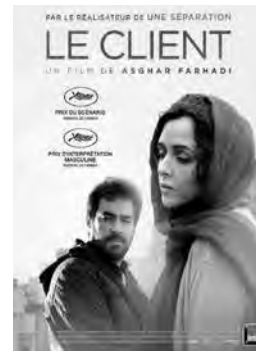
LE CLIENT Drame d'Asghar Farhadi Iran - 2016 - 2h03