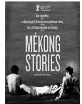
MÉKONG STORIES Drame de Phan Dang Di Vietnam - 2015 - 1h38