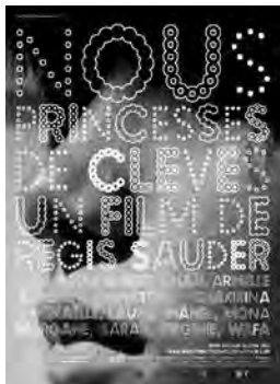
NOUS, PRINCESSES DE CLÈVES Documentaire de Régis Sauder France - 2010 - 1h10

Infos et catalogue complet sur www.videoenpoche.info