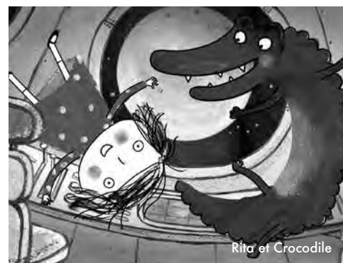
Rita et Crocodile

Ciné-lecture : le lundi 12 à 16h30 la projection sera précédée de la lecture d'un conte et suivie d'un goûter offert !