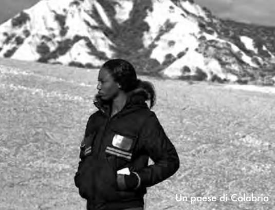
Un paese di Calabria