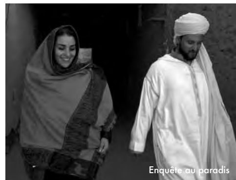
Enquête au paradis