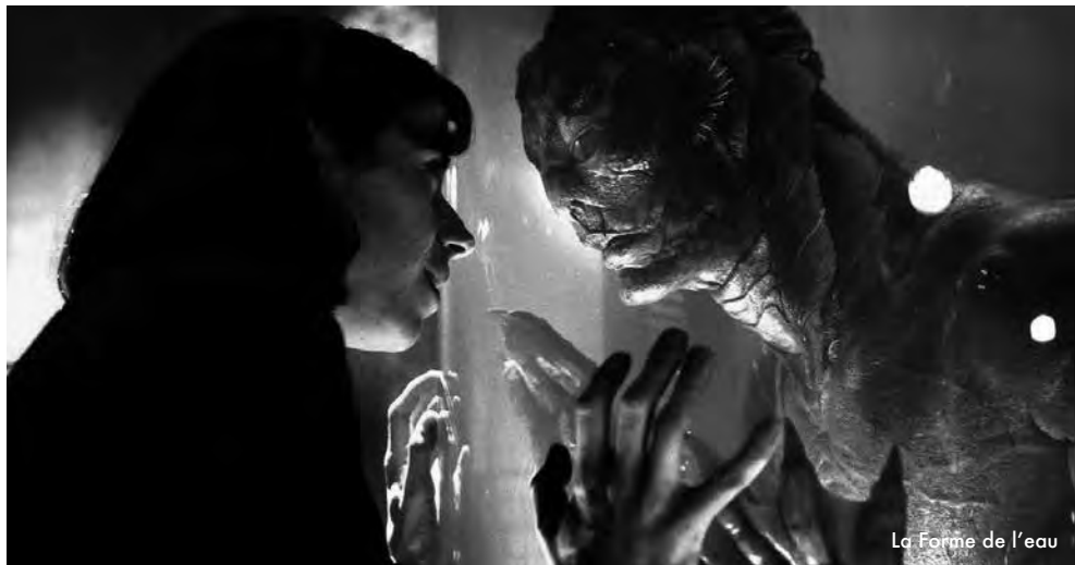
La Forme de l'eau

TARIFS HABITUELS, SAUF ADHÉRENTS DIETRICH ET TOIT DU MONDE : 4 €.