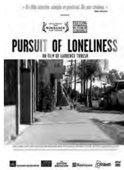
PURSUIT OF LONELINESS Drame de Laurence Thrush USA - 2012 - 1h38