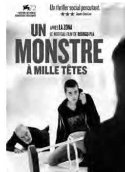
UN MONSTRE À MILLE TÊTES Drame de Rodrigo Plá Mexique - 2015 - 1h14