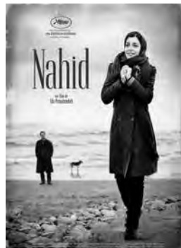
NAHID Drame d'Ida Panahandeh Iran - 2014 - 1h44