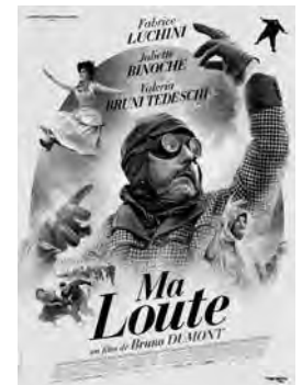
MA LOUTE Comédie de Bruno Dumont France - 2016 - 2h03