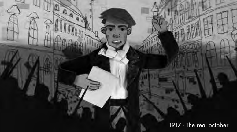
1917 - The real october