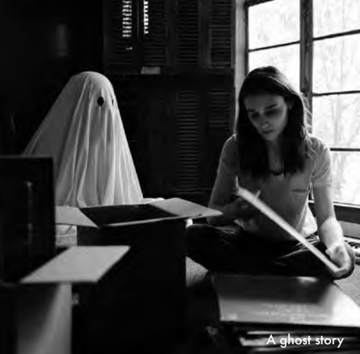
A ghost story