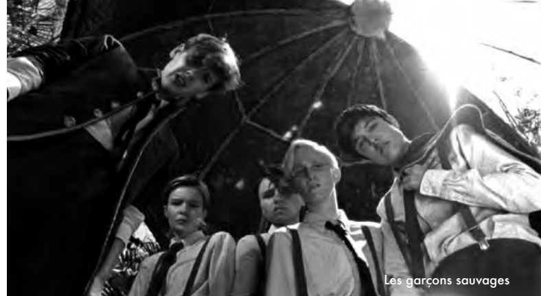
Les garçons sauvages