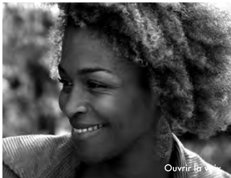
Ouvrir la voix