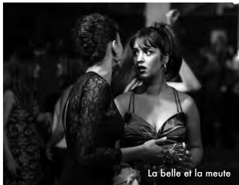
La belle et la meute

Tout comme il joue avec les codes des films de maison hantée, David Lowery oriente son récit vers des directions déjouant les attentes du spectateur. En dire davantage risquerait de gâcher le plaisir de celles et ceux qui découvriront A Ghost Story [...]. Il suffit de se laisser prendre par l'atmosphère cotonneuse, la tonalité élégiaque et les compositions mélancoliques de Daniel Hart pour goûter pleinement à cette proposition de cinéma fantastique humble - sans effet tape-à-l'œil - et paradoxalement audacieuse. www.lebleudumiroir.fr