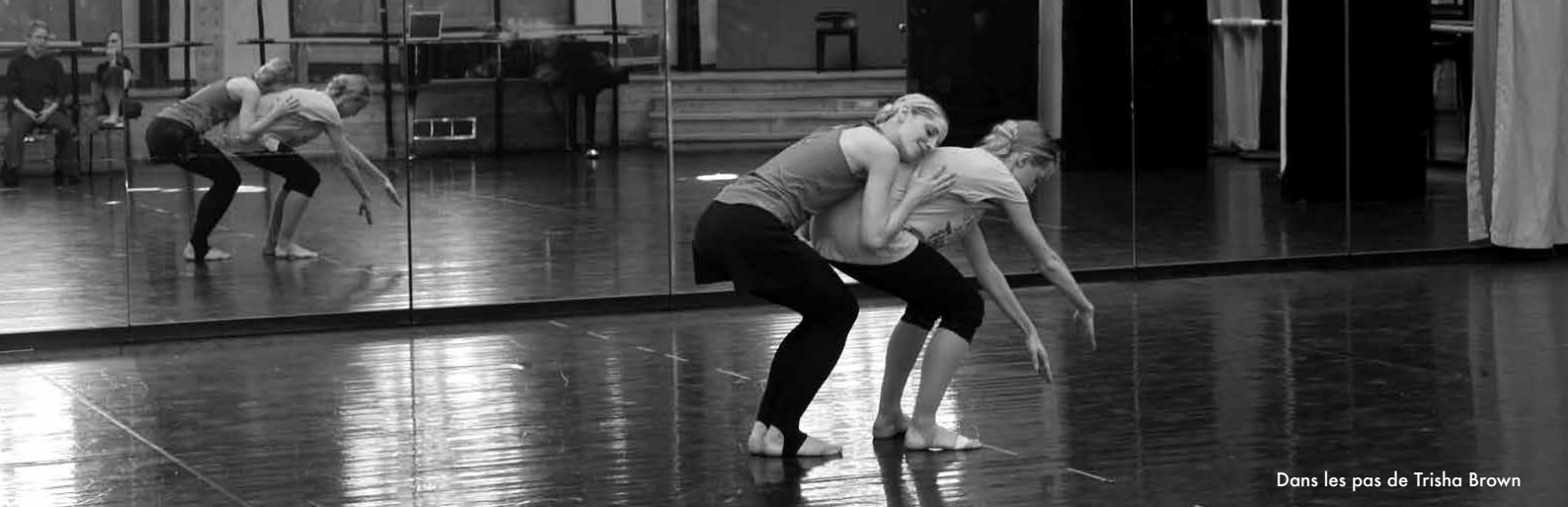
Dans les pas de Trisha Brown