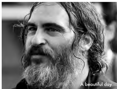
A beautiful day