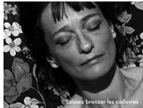
Laissez bronzer les cadavres