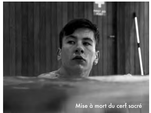
Mise à mort du cerf sacré