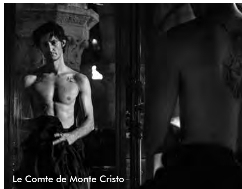
Le Comte de Monte Cristo

Un récit initiatique profondément émouvant, servi par des jeunes comédiens qui crèvent l'écran, ainsi que le toujours impeccable Damien Bonnard et... Artus, dans un contre-emploi étonnant. Télérama