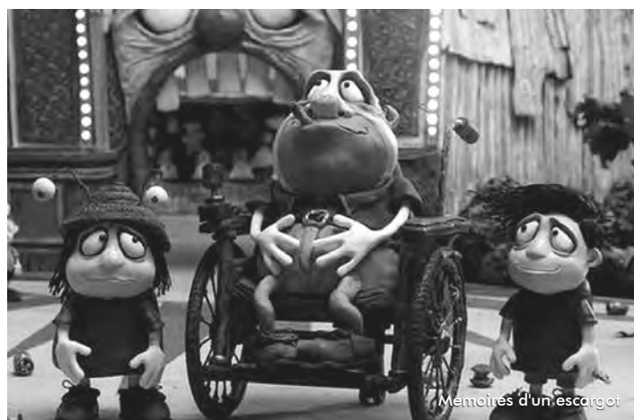
Mémoires d'un escargot

La séance du mercredi 15 janvier à 21h sera introduite par les ambassadeur-ric-e-s étudiant-e-s du Dietrich qui vous présenteront le film et le travail du réalisateur Adam Elliot. Quinze ans après le déchirant Mary and Max (2009), le réalisateur signe un nouveau chef d'œuvre d'animation pour adultes, confirmant tout son intérêt pour les destins brisés. Dépassant l'observation de la cruauté, de l'injustice voire de l'horreur, Adam Elliott ouvre aussi vers un espoir qui vous prend à la gorge. Ses figures de pâtes à modeler animées en stop motion offrent des expressions si vivantes que leurs émotions sont insurpassables. www.forumdesimages.fr