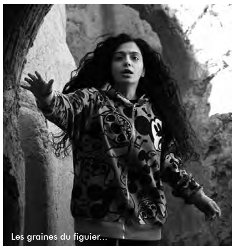
Les graines du figuier...

L'une des surprises du Festival de Cannes 2024, du body horror aussi gore que mental sur la haine de soi au féminin. Portée par Demi Moore et Margaret Qualley, une impressionnante expérience visuelle. Télérama