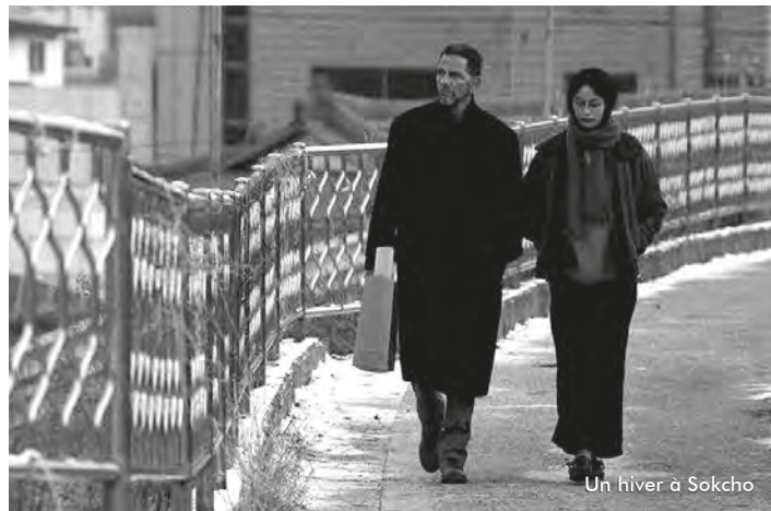
Un hiver à Sokcho