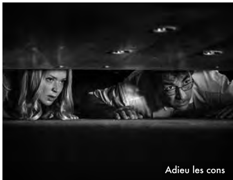
Adieu les cons