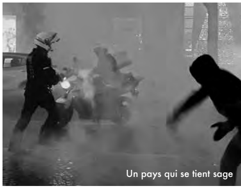
Un pays qui se tient sage