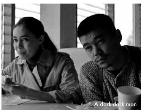
A dark-dark man

Une passionnante démonstration de savoir-faire et de mise en scène, doublée d'un portrait acerbe de la société. [...] Au croisement d'un Aki Kaurismäki et d'un Jacques Tati qui se serait essayé au film policier, Yerzhanov réalise un film au sujet peu propice à la rigolade, mais qui arrive à insuffler un petit souffle de drôlerie, d'incongru et de non-sens, comme si tout ce qui se passait était tellement ridicule et pathétique qu'on se doit d'en rire pour ne pas avoir à trouver ça désespérant. eastasia.fr