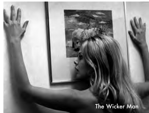
The Wicker Man