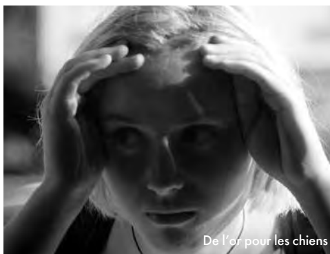
De l'or pour les chiens