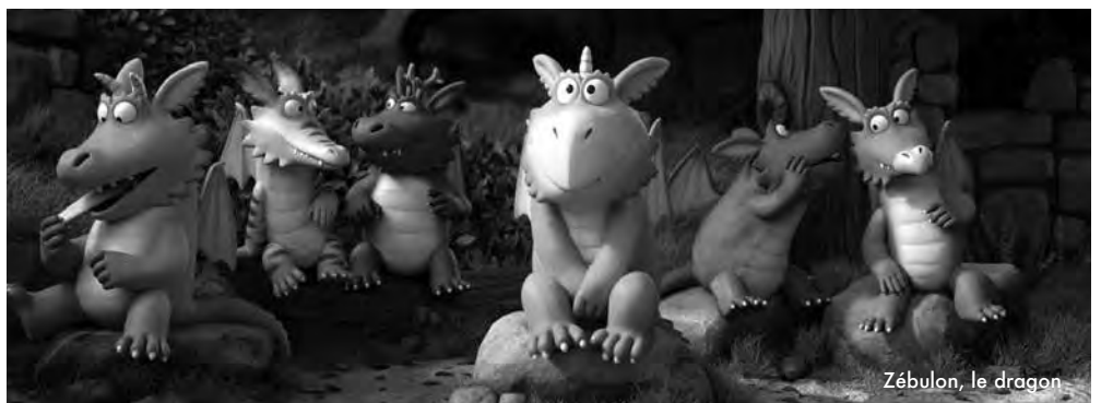
Zébulon, le dragon

TARIF UNIQUE : 3 € / GRATUIT POUR LES MOINS DE 12 ANS.