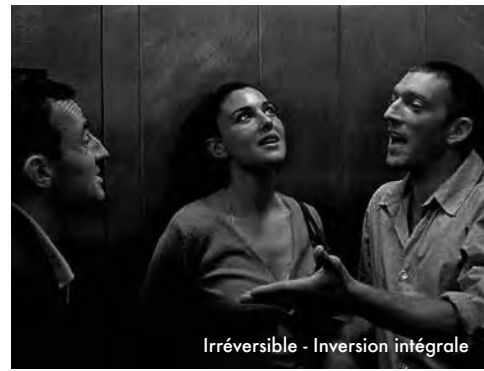
Irréversible - Inversion intégrale