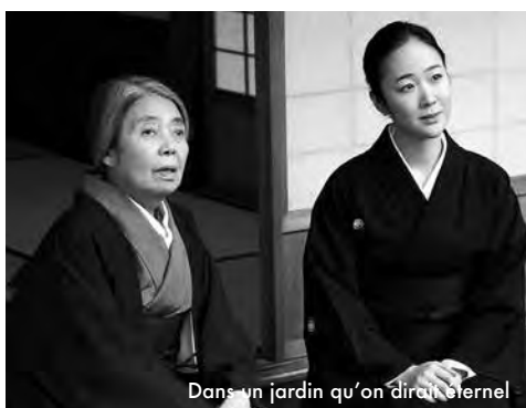
Dans un jardin qu'on dirait éternel

La tradition de la cérémonie du thé constitue un miroir sur le passé du Japon, ainsi qu'un révélateur pour celles qui la pratiquent. Elle leur apprend à relativiser et à apprécier les bonheurs simples, à percevoir la beauté de chaque jour, dans les détails imperceptibles. Le film de Tatsushi Omori est une ode à l'instant présent, à vivre chaque moment pleinement. [...] Une philosophie qui résonne d'autant plus fortement en ces temps troublés. www.lebleudumiroir.fr