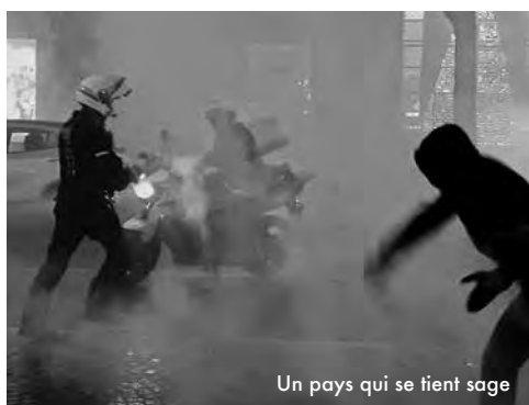
Un pays qui se tient sage

Un documentaire choc, certes partisan, qui montre avec effroi, à partir d'images saisies sur des portables de gilets jaunes, les rouages d'une violence policière, prise en tenaille entre sa mission de faire régner l'ordre public et, pour certains, le sentiment de toute-puissance. Proprement saisissant. www.avoir-alire.com