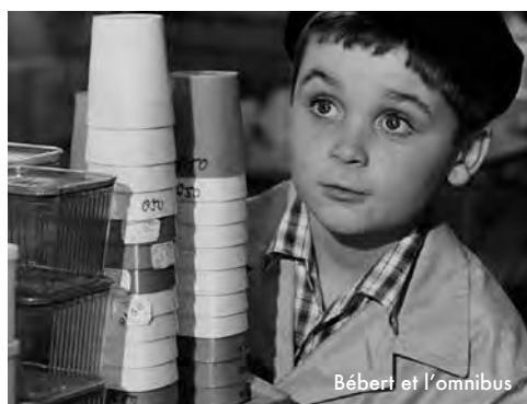
Bébert et l'omnibus

[Un] des classiques du cinéma consacré à l'enfance, au même titre que La Guerre des boutons du même Yves Robert ou que Zazie dans le métro de Louis Malle [...], avec lesquels ils partagent un dialogue plein de verve, de malice et d'inventivité et une interprétation de qualité jusque dans les seconds rôles ou apparitions. [...] Plein de tendresse pour le monde de l'enfance, de drôlerie et de poésie. www.lebleudumiroir.fr