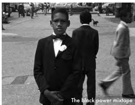
The black power mixtape

Ce documentaire retrace l'évolution du mouvement Black Power de 1967 à 1975 au sein de la communauté noire. Le film associe musique et reportages (des rushes en 16 mm restés au fond d'un placard de la télévision suédoise pendant plus de trente ans), ainsi que des interviews de différents artistes, activistes ou musiciens qui sont des piliers de la culture afro-américaine. Bien qu'à première vue il puisse nous sembler familier, l'objet est tout à fait inhabituel. Remontage d'images d'époque inédites tournées par des équipes suédoises, il s'accompagne de commentaires par des figures modernes du mouvement de défense des Noirs. Le regard est, à bien des égards, extérieur : loin de l'époque, loin du lieu, loin même des hommes qui ont conçu le premier matériau du film, ses rushes. Comme on résout un puzzle, et peut être avec une certaine prise de position, Göran Olsson reconstruit année après année les fragments de l'inconscient collectif noir américain. www.critikat.com