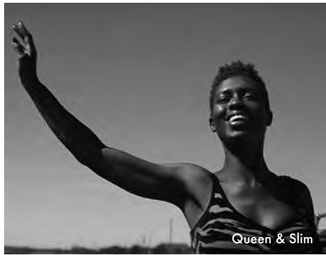
Queen & Slim