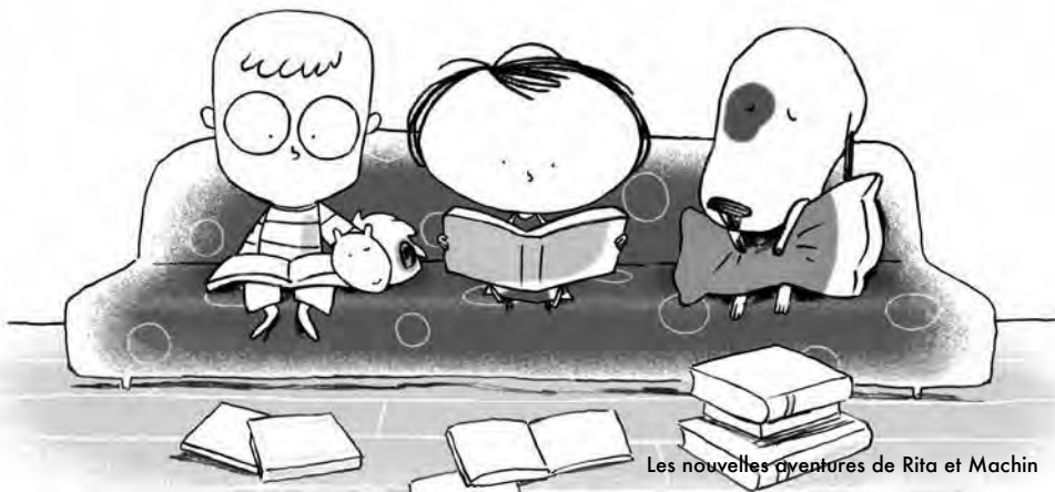
Les nouvelles aventures de Rita et Machin