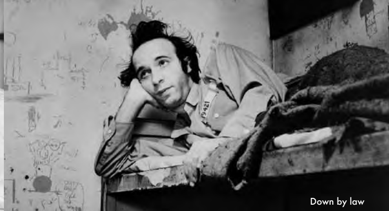
Down by law