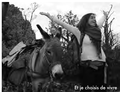
Et je choisis de vivre

Mieux qu'un hommage, le film est une leçon de vie, une œuvre lumineuse qui parle du deuil avec justesse et authenticité. Pas simplement du deuil de l'enfant, de tous les deuils, du deuil « universel ». Amande bouleverse en acceptant de mettre à nu sa douleur, son désarroi, ses questionnements les plus intimes. www.telerama.fr