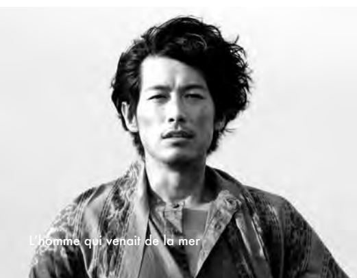
L'homme qui venait de la mer