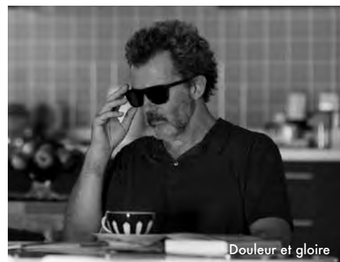
Douleur et gloire

Et profitez de la ressortie en version restaurée d'une grande partie des films d'Almodóvar pour (re-)découvrir sur votre écran en juillet et en août ses premières œuvres (voir au verso) !