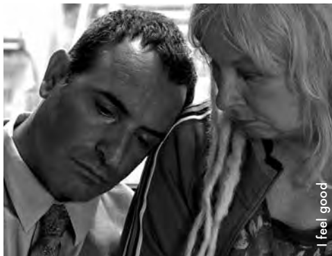
I feel good