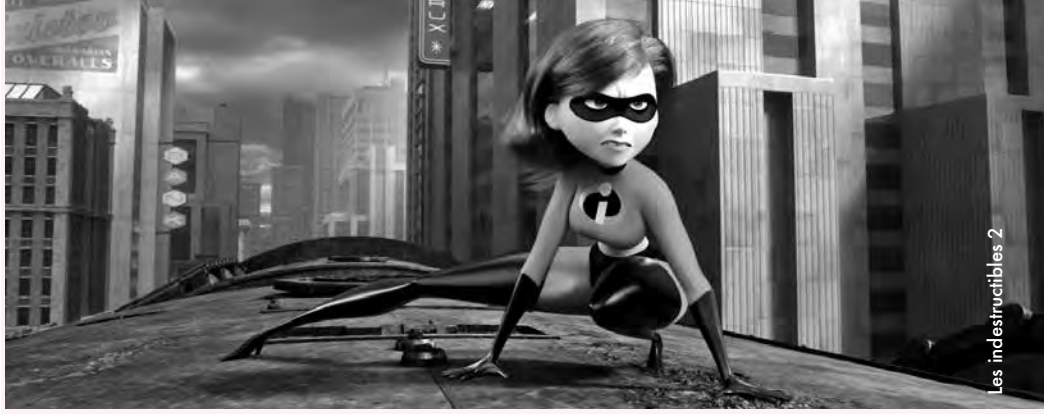
Les indestructibles 2