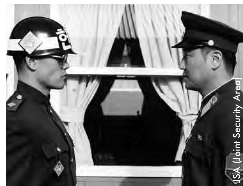
JSA (Joint Security Area)