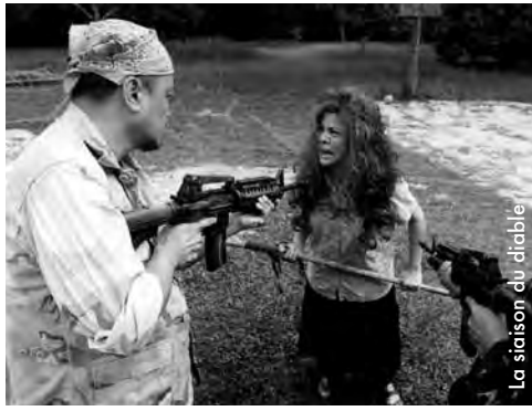
La saison du diable