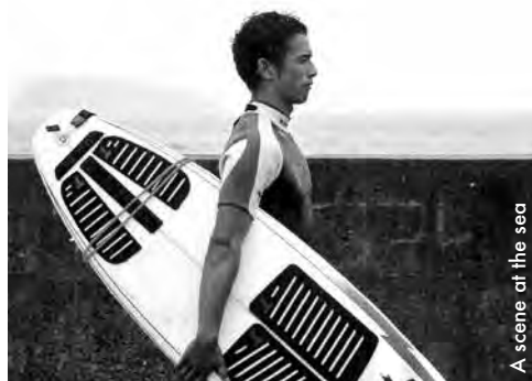
A scene at the sea

Un jeune éboueur sourd-muet se prend d'une passion obsessionnelle pour le surf. Soutenu par le regard protecteur de sa fiancée, sourde-muette comme lui, le jeune homme progresse, d'apprentissages éprouvants en compétitions harassantes, jusqu'à ce que la mer les sépare. Les amours contemplatifs de deux sourds-muets sous l'œil fasciné de Kitano. [...] Nettement plus équilibré que son prédécesseur [Jugatsu], ce troisième film distille une mélancolie douceâtre, bercée par les premières compositions de Joe Hisaishi pour le réalisateur japonais. [...] Ce film constitue une parenthèse étonnante dans sa carrière. A Scene at the Sea se ressent comme le souffle du vent marin : simple et fort, subtil et agréable. www.avoir-alire.com