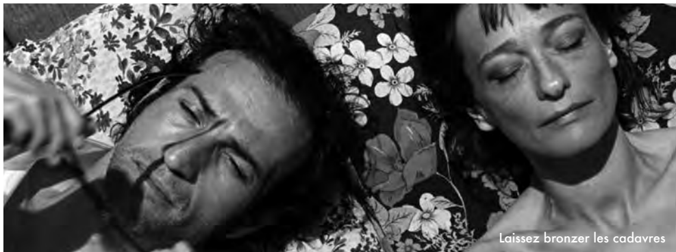
Laissez bronzer les cadavres