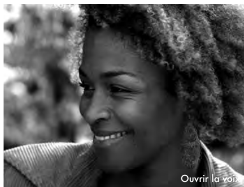
Ouvrir la voix

LE 24/09 : TARIFS HABITUELS (SAUF ADH. TOIT DU MONDE ET SOS RACISME : 5 €)