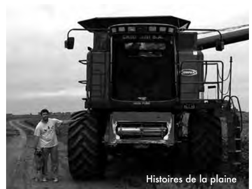
Histoires de la plaine

PLEIN TARIF : 5,5 € / ADHÉRENTS DIETRICH : 4 €