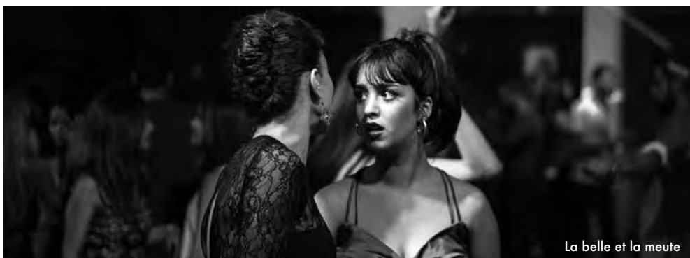
La belle et la meute

Pour Claudette, comme pour tous les autres personnages de Sans adieu , le monde d'aujourd'hui marche sur la tête. La rentabilité à tout crin, l'argent-roi, le consumérisme sont contraires à l'humain (...). Tous ces paysans sont attachés à un univers où les bêtes et les choses avaient de la valeur, et où la vie des hommes n'avait pas de prix. Mais on ne voit plus en eux que leur misère, leur inadaptation, leur immobilisme. Christophe Agou est un révélateur de leur richesse et de leur beauté. Sans adieu est un antidote splendide et bouleversant à nos dérives contemporaines. Quelle rage et quelle tristesse que son auteur ne soit plus ! www.politis.fr