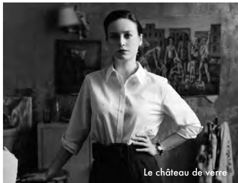
Le château de verre