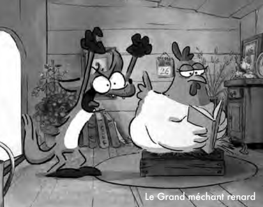
Le Grand méchant renard