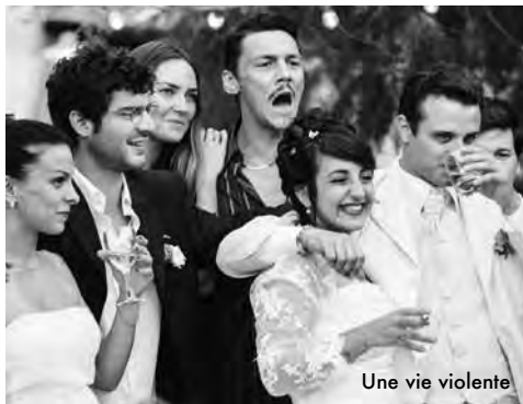
Une vie violente

Techniquement proche de la perfection, et aussi riche en aventures qu'en personnages à l'étrange humanité. www.abusdecine.com