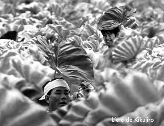
L'été de Kikujiro