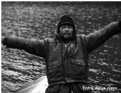
Entre deux rives