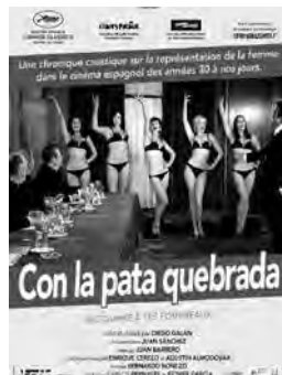
Documentaire de Diego Galan Espagne - 2013 - 1h23

À travers des parcours de vie aussi poignants qu'intimes, ce documentaire explore le processus d'intégration des mineurs isolés étrangers, ces jeunes de moins de 18 ans venus du monde entier, souvent au péril de leur vie, qui débarquent à Marseille, sans bagage ni visa, pour tenter d'y construire un avenir. En attendant leur majorité, ils sont mis sous la protection de l'aide sociale à l'enfance. Commence alors, pour eux, un autre périple... Ce film a pour objectif de nous donner à voir autrement ces jeunes exilés solitaires.