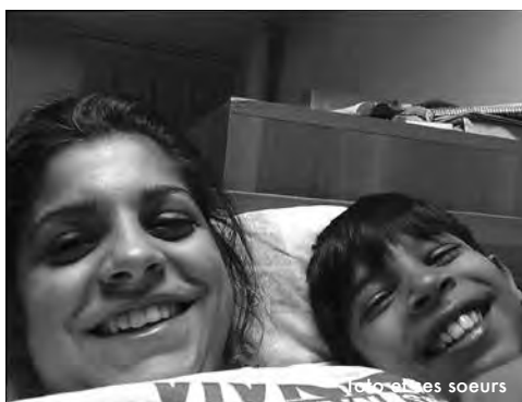
Toto et ses soeurs