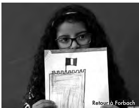
Retour à Forbach

C'est en apprenant l'incroyable montée du vote FN dans la petite ville du bassin houiller de Lorraine qui l'a vu grandir que l'ancien enfant, devenu professionnel de l'image, décide de braquer ses objectifs sur ce lieu intime, afin de tenter de comprendre son évolution. (...) Par delà le morcellement de ces témoignages transpire une douleur commune, un désarroi. www.senscritique.com