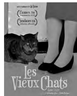
Comédie dramatique de Sebastian Silva et Pedro Peirano / Chili - 2011 - 1h27