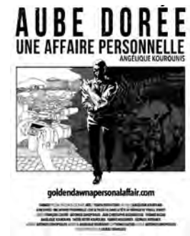
Documentaire d'Angélique Kourounis Grèce, France - 2016 - 1h30