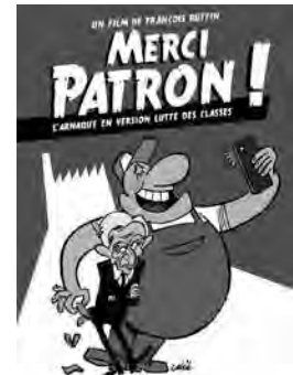
Documentaire de François Ruffin France - 2016 - 1h24