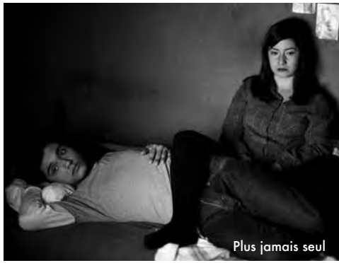
Plus jamais seul