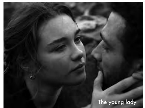
The young lady